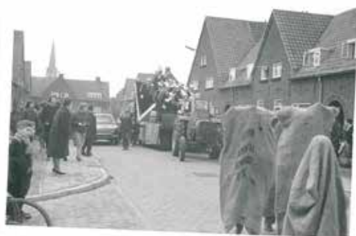
Carnavalswagen CV de Kluppels bij Pastoor van Massenhovenstraat.