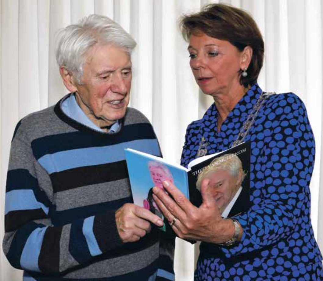
Even samen door het boek bladeren.