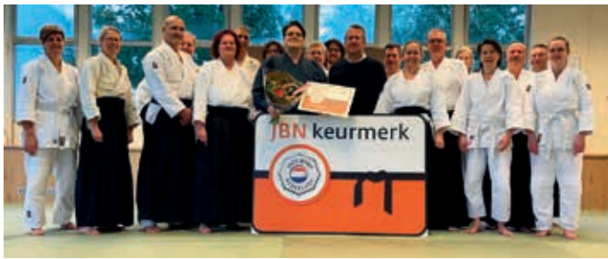
Het JBN-keurmerk werd uitgereikt aan Torii | F Ki-Aikidoschool Torii