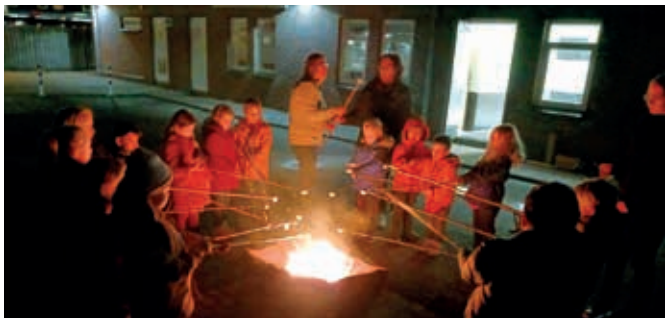
De Bevers roosterden marshmallows boven een stookton | F Scouting Mierlo-Hout