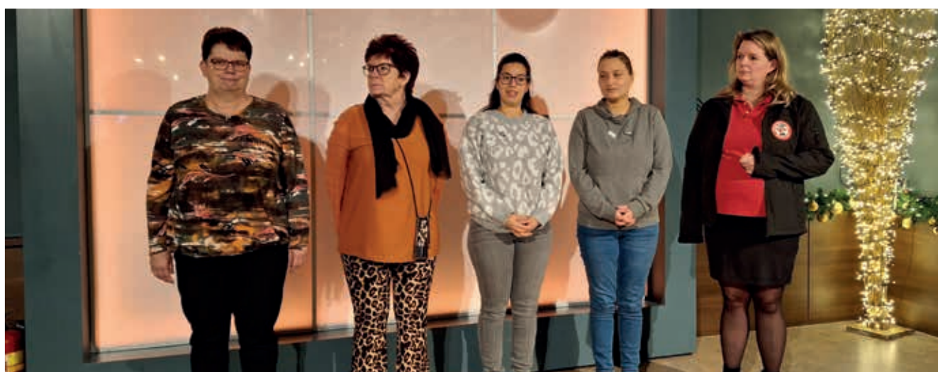
Groepering Mierlo-Hout 2023 Werkgroep Jeugd