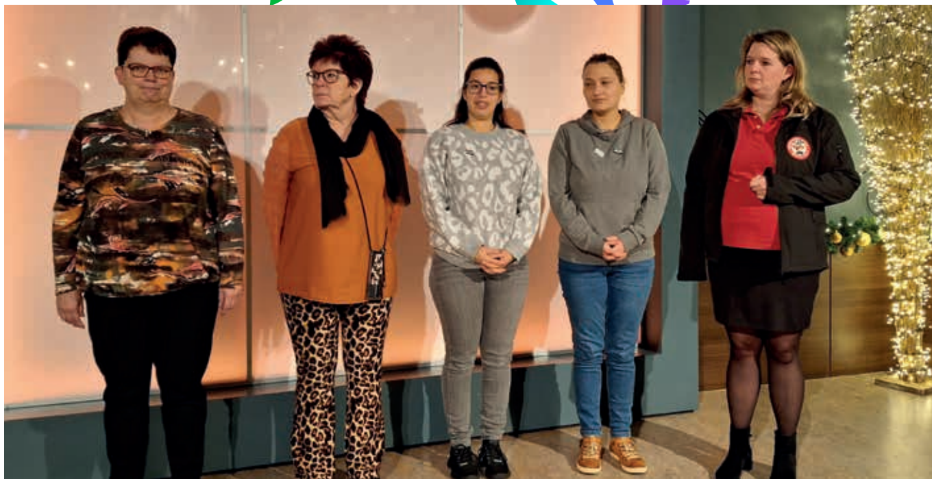
De winnaars van Groepering Mierlo-Hout 2023: Werkgroep Jeugd