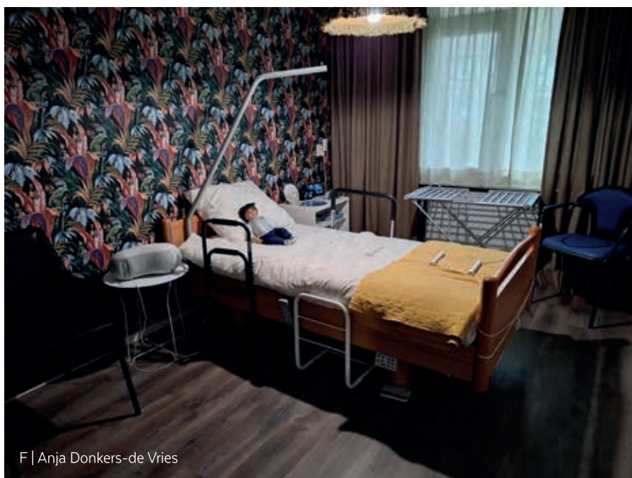
F | Anja Donkers-de Vries