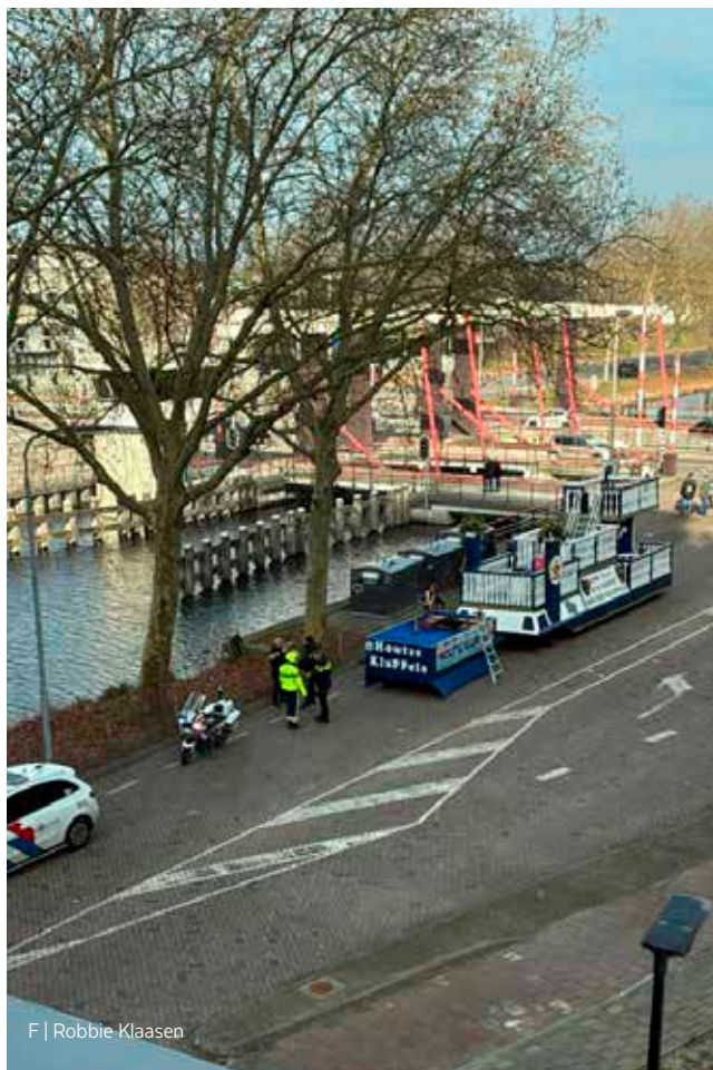
F | Robbie Klaasen

Maar toch? Een verkeerd signaal, vrijwilligers worden door de vele regels ontmoedigd. Wil de laatste vrijwilliger de deur dichtdoen?