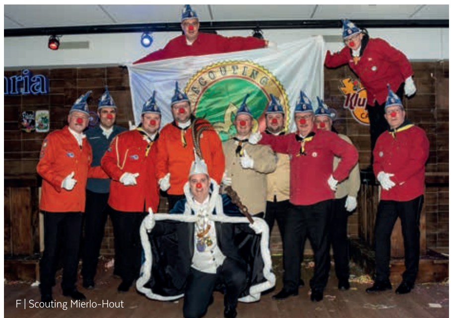
F | Scouting Mierlo-Hout

Op zaterdagmiddag 7 februari barstte het feest los in Hoftempel De Geseldonk. Onze jongste groepen vierden samen met de Kleine Kluppelkes carnaval zoals het bedoeld is: uitbundig, kleurrijk en met meer energie dan menig volwassen feestganger aankan. Er werd gedanst, gelachen en fanatiek meegedaan. De toekomst