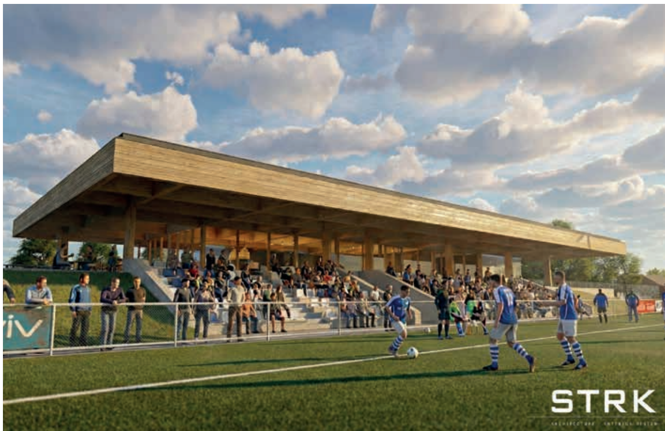
Een impressie van het toekomstige project. Ontwerp: STRK, Architecture-Interior design