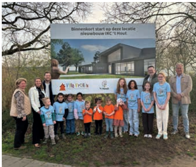
De onthulling van het bouwboard