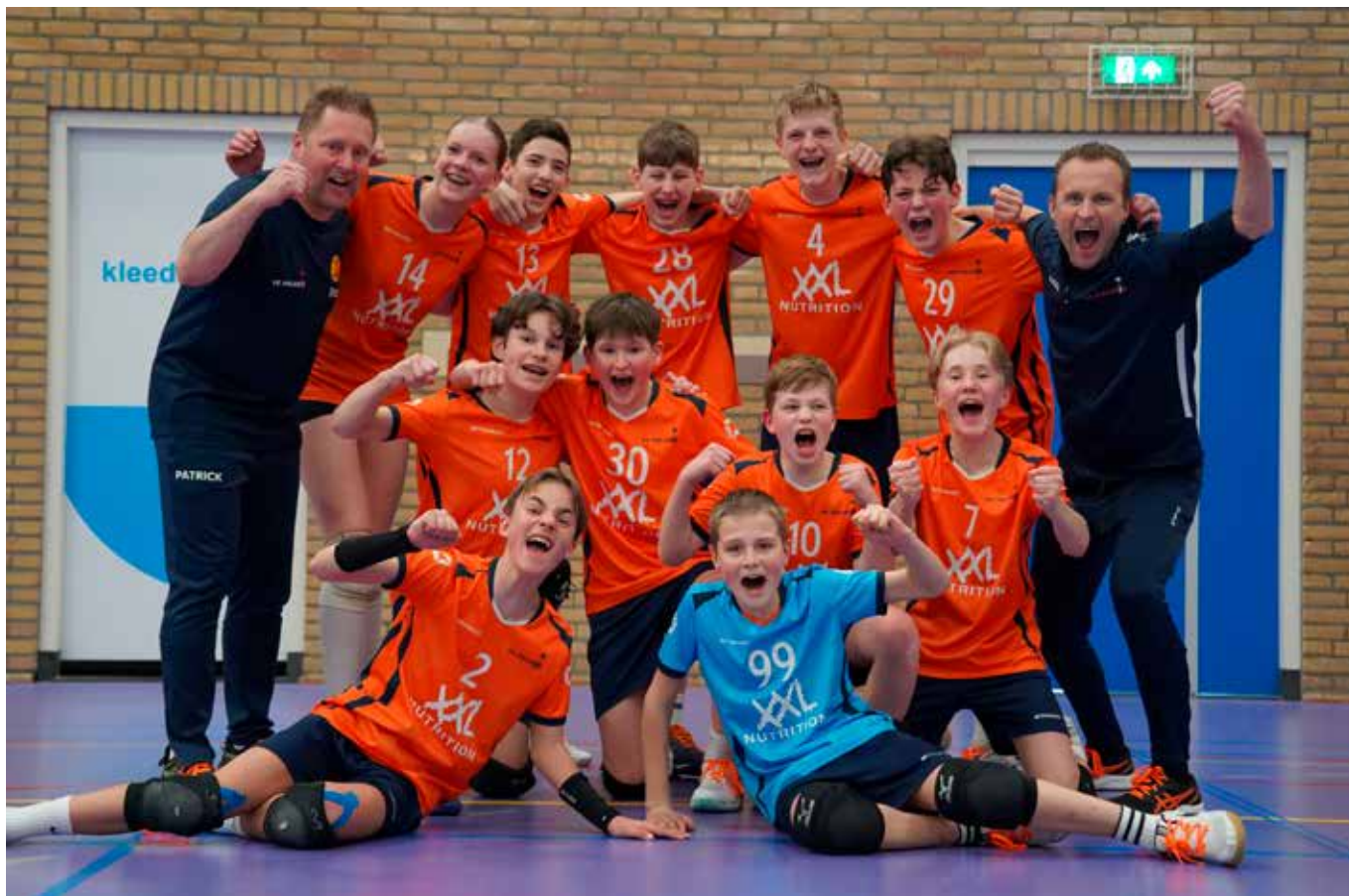
Het overgelukkige team.