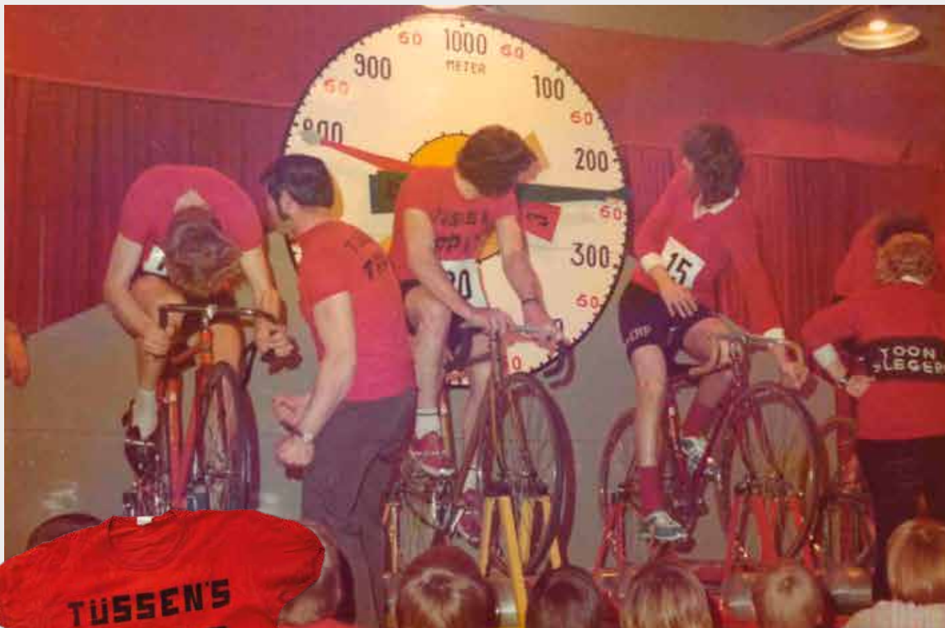
In volle sprint, team Tijssen Tapijt tegen Team Schildersbedrijf Slegers.