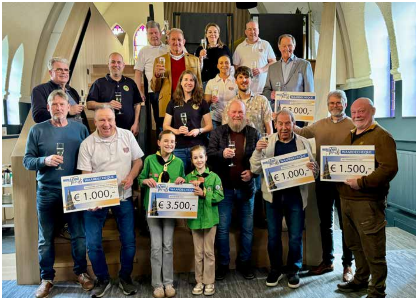
Stichting Mierlo-Hout Fonds verraste maar liefst vijf verenigingen en stichtingen met een donatie.