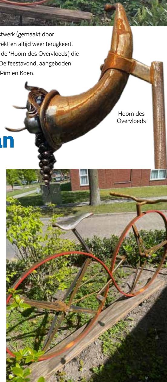
Hoorn des Overvloeds

En de toekomst? Die zien ze met vertrouwen tegemoet. Met plannen voor een eigen 'zorgburotje' met het exploiteren van elkaars PGB-zakje, elektrische mountainbikes en misschien zelfs een duofiets, blijft de club in beweging - letterlijk en figuurlijk en ze blijven komen en gaan vanuit het eigen clubhuis: Eetcafe de Barrier. Eén ding is zeker: 't Hou(d)t Nooit Op.