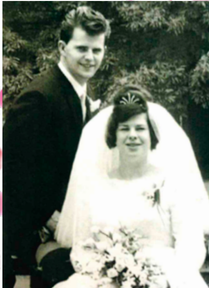
Zestig jaar geleden!