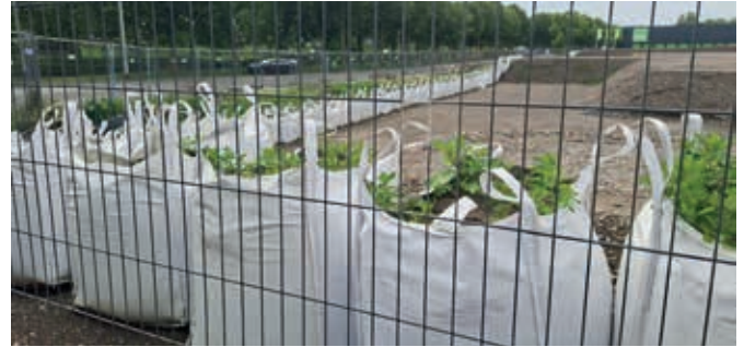
De zandzakken staan er al een tijdje

Vorig jaar oktober is gestart met het saneren van de grond. Voor het PTT-gebouw schijnt er een vuilstortbedrijf gezeten te hebben wat een verontreiniging van de grond veroorzaakt heeft. Waar buizen, leidingen en kabels in de grond komen te liggen, werd de grond helemaal afgegraven en schone grond gestort. De rest is met schone grond opgehoogd. Waar nu de grond wat dieper uitgegraven is, is een heel zandpakket en de grote witte zandzakken (de big bags) erbovenop gezet, zodat de grond in kan